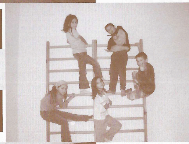
Děti na žebřinách v Klubu Velryba - klub pro děti