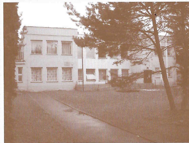
Zleva: Chráněná dílna Jonáš a Dům Jonáš - dům pro matky s dětmi v tísní