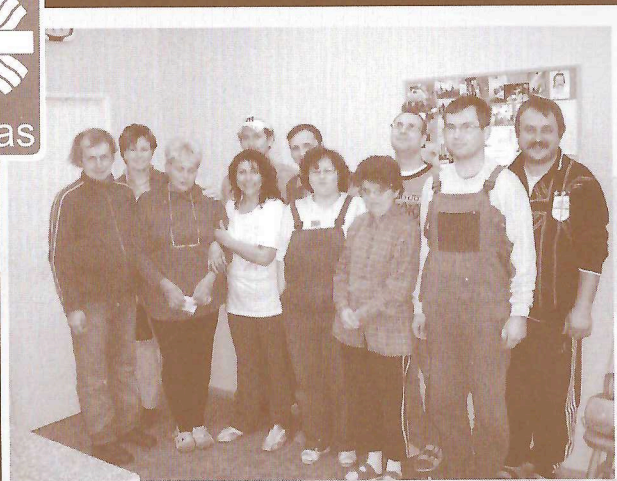
Kolektiv Chráněné dílny Jonáš