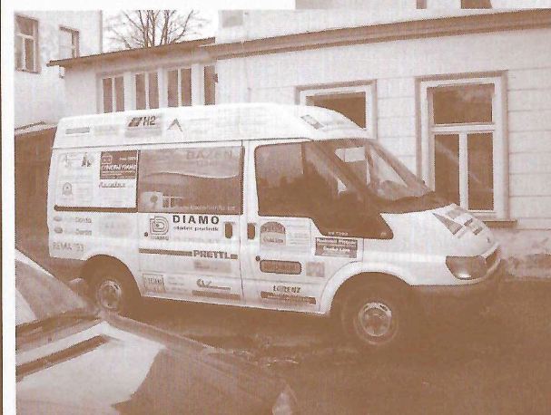
Vozový park Farní charity před budovou čp. 992