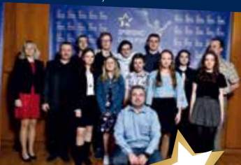
Tým mládeže: 1. Sportovní střelecký klub Maušiče (střelectví)