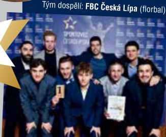
Tým dospělí: FBC Česká Lípa (florbal)