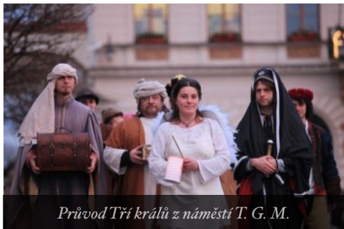
Průvod Tří králů z náměstí T. G. M.

aneb 15 let Tříkrálové sbírky na Českolipsku