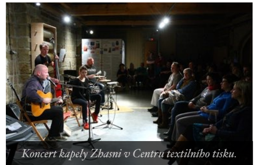
Koncert kapely Zhasni v Centru textilního tisku.