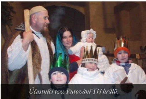
Účastníci tzv. Putování Tří králů.