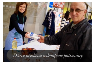
Dárce předává zakoupené potraviny.

Dobrovolnické centrum – Farní charita Česká Lípa se úspěšně zapojila do celorepublikové dobrovolnické akce s názvem Potravinový pomáhají, kterou pořádá Národní potravinová sbírka. Akce se konala po celou listopadovou sobotu 21. 11. v hypermarketu Albert v České Lípě. Návštěvníci se zapojili do této sbírky zakoupením a odevzdáním potravin u dobrovolníků charity. Během sobotního dne se vybralo do nákupních košíků cca 438 kg potravin za bezmála 20.000 Kč. Ty putovaly pomoci klientům služeb Farní charity Česká Lípa – matkám s dětmi v tísní a sociálně slabým spoluobčanům.