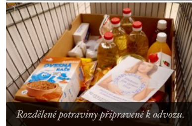
Rozdělené potraviny připravené k odvozu.