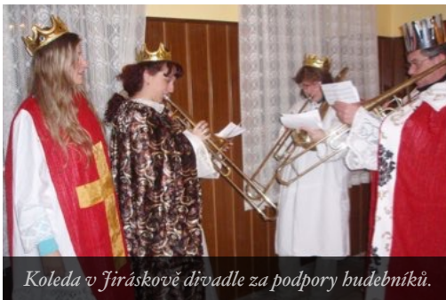
Koleda v Jiráskově divadle za podpory hudebníků.

Vokální trio UNISONO Občanského sdružení MBHB – umělecká společnost Česká Lípa