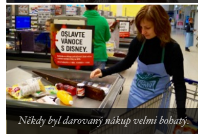
Někdy byl darovaný nákup velmi bohatý.