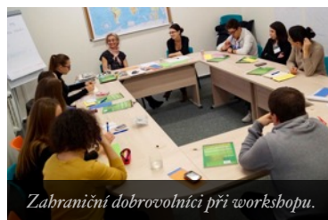
Zahraníční dobrovolníci při workshopu.

Dobrovolnické centrum – Šest mezinárodních dobrovolníků z projektu Erasmus+, kteří jsou od listopadu na ročním pobytu v České Lípě, se postupně aklimatizuje