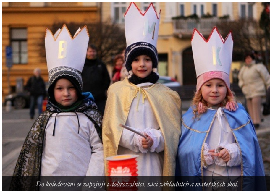
Do koledování se zapojují i dobrovolníci, žáci základních a mateřských škol.

již dosluhuje a musí být nahrazen novým. V kouzelném prostoru Centra textilního tisku u vodního hradu v rámci hudebně-divadelního odpoledne a podvečeru vystoupí nejen zmínění Zhasni, ale i klavírista David Tichý a divadelní soubor Progresky, který představí svou podobu improvizčního divadla. Představení i koncert se konají 9. ledna od 15:00, resp. od 19:00 za dobrovolné vstupné do tříkrálových kasiček.