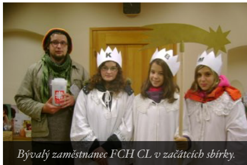
Bývalý zaměstnanec FCH CL v začátcích sbírky.

V následujícím roce bylo obsazení koledníků stejné, zato v roce 2009 se ke koledě přidali učni ze SOU v České Lípě a DDM Libertin. Koledníci z Libertinu si sami připravili kostýmy i vlastní aranžmá populární koledy o Třech kráľích. Dlužno podotknout, že v jejich podání koleda zaujala a mile překvapila. V následujících letech se pak roli Tří kráľů zhostili také žáci ze Základní školy Špičák Česká Lípa, Zákupy, Nový Oldřichov, Stružnice a ze Základní a Mateřské školy Dubá. Ke koledování se také přidaly dobrovolnice skautského oddílu Korál Přístavu Ralsko Mimoň. Ti všichni koledovali ve prospěch potřebných pod dohledem dospělých vedoucích skupinek.