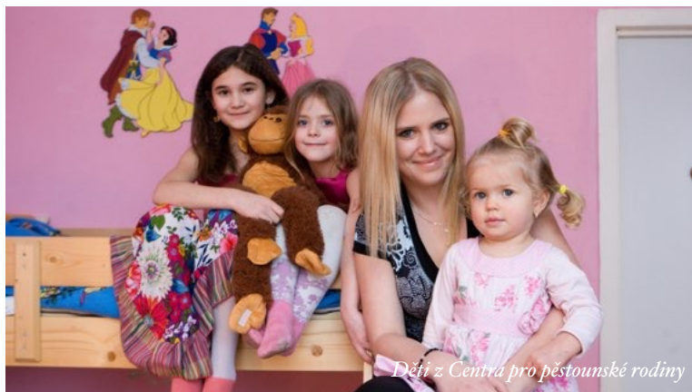
Děti z Centra pro pěstounské rodiny

Jak vidíte, jsou to lidé z řad veřejnosti, tak i firmy. U asistence dětí z azylového domu nebo Centra pro pěstounské rodiny stačí, aby dotyčný měl pár hodin v týdnu volný čas a chtěl dětem rozšířit rozhled. Dobrovolník je může vzít do kina, do divadla nebo na sportovní zápas. Také je možná pomoc s doučováním. V tuto chvíli jsme v kontaktu s místním florbalovým oddílem a pokračujeme tak ve spolupráci, která započala sbírkou během loňských Vánoc.