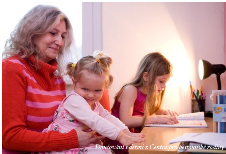
Dončování s dětmi z Centra pro pěstounské rodiny

Sociální automobil – Díky koledníkům ze ZŠ Špičák, Dr. M. Tyrše, Nový Oldřichov, Zákupy, Dubá, Stružnice a mimořádným skautům bylo v lednu 2015 vybráno úctyhodných 81 151 Kč, z nichž 65 % putuje na provoz Sociálního automobilu, který rozváží zdravotně hendikepované děti do školy a ze školy. Více na www.trikralovasbirka.cz .